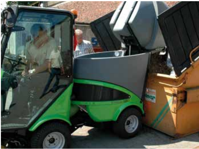
Hydraulisk tippfunktion direkt i container