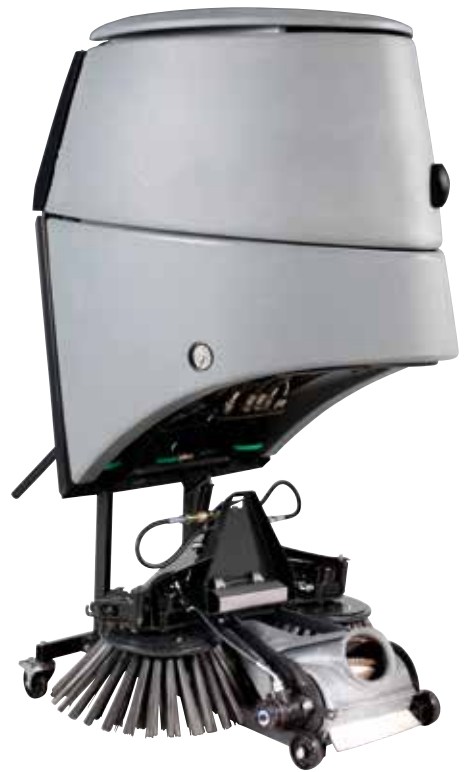
Kräver minimal plats vid förvaring